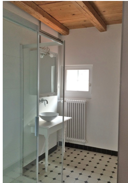
Durch die Abtrennung der Toilette konnte das Bad im zweiten Obergeschoss vergrössert werden.