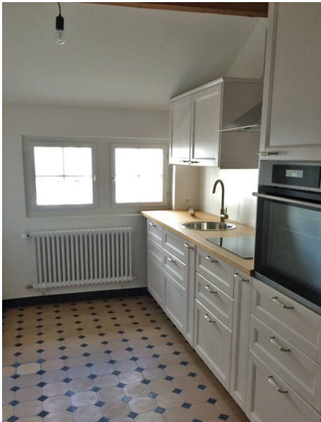
In der Wohnung im zweiten Obergeschoss wurde eine neue Küche eingebaut. Die Decke wurde neu verkleidet und weiss gestrichen und sorgt so für mehr Helligkeit.