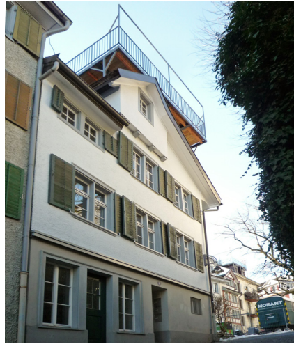
Die Fenster an der Südfassade wurden fast alle erneuert und erfüllen nun zeitgemässe Energiestandards.