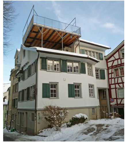
Die durch verschiedene Bauetappen entstandene, abgewinkelte Baulinie passt in ihrer Kleinteiligkeit gut ins Erscheinungsbild des Platzes.