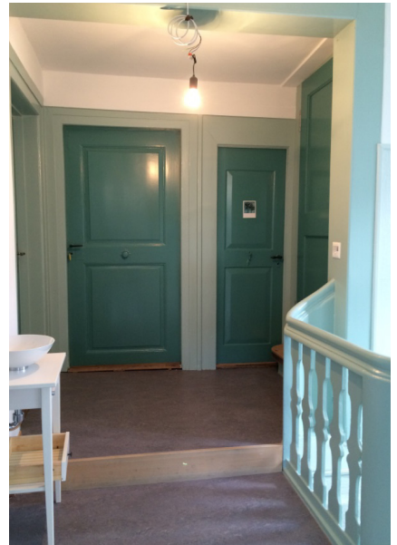
Die Farben der Wohnungseingänge im ersten Obergeschoss wurden leicht angepasst und aufgefrischt.